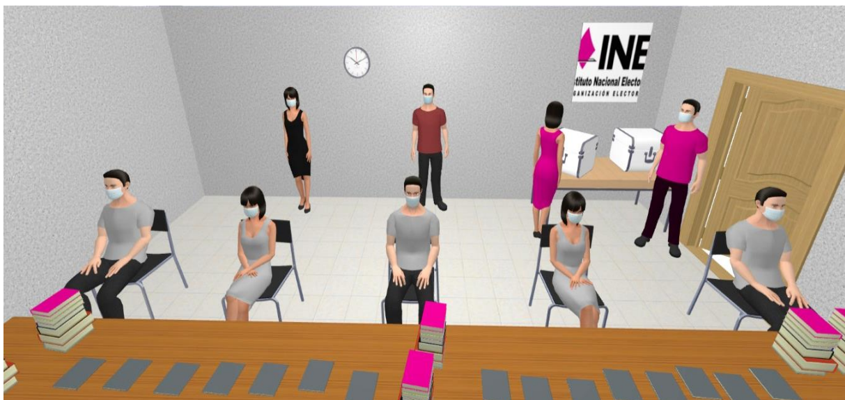
Imagen 2a Vista en tres dimensiones del modelo de distribución de personas en un Punto de Recuento (vista horizontal)

Nota: Los modelos presentados son para efectos ilustrativos de este Protocolo.