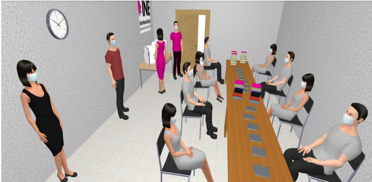
Imagen 3 Vista en tres dimensiones del modelo de distribución de personas en un Punto de Recuento (vista vertical)

Nota: Los modelos presentados son para efectos ilustrativos de este Protocolo.