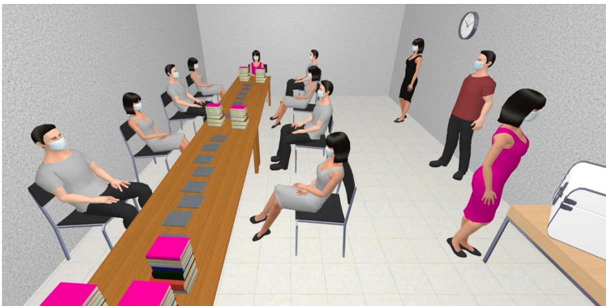
Imagen 3b Vista en tres dimensiones del modelo de distribución de personas en un Punto de Recuento (vista vertical)

Nota: Los modelos presentados son para efectos ilustrativos de este Protocolo.